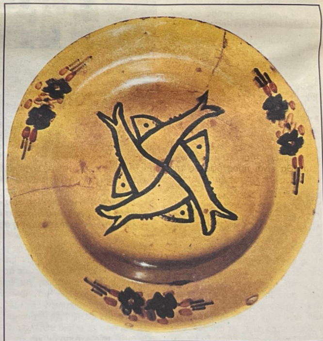
Πιάτο με ζωγραφικό σύμπλεγμα από τέσσερα ψάρια. Σίφνος (από το βιβλίο του Β. Κυριαζόπουλου, «Ελληνικά παραδοσιακά κεραμικά»).

Αν και η εγκατάσταση στην πόλη αποτέλεσε ατομική επιλογή, οργανώθηκε άτυπα ένα δίκτυο διοχέτευσης των άνεργων στη Σίφνο τεχνιτών του πηλού στα αγγειοπλαστεία της Αθήνας που ανήκαν σε Σιφνιούς. Ένα τυχαίο γεγονός, ο γάμος του αγγειοπλάστη Αγγελή Παλαιού με Μαρουσιώτισσα, τον οδήγησε να εγκατασταθεί, ήδη από το 1833, στο μικρό για την εποχή εκείνη συνοικισμό της Αττικής. Αλλά το Μαρούσι έχει παχιά κόκκινη άργιλο και άφθονο νερό. Γι' άλλη μια φορά, η φύση προσέφερε επιλογές και οι Σιφνιοί τις αξιοποίησαν. Μόνο που στην περίπτωση αυτή, τα αγγειοπλαστεία από τσικαλαριά μετατράπηκαν σε κανατάδικα. Οχι γιατί μόνο η άργιλος της Σίφνου είναι η πλέον κατάλληλη για το πλάσιμο των τσικαλιών, αλλά και γιατί η πλατεία του Μαρουσιού, όπου βρισκόταν η βρύση με τα λιοντάρια, μετατράπηκε στο κέντρο της υδροδότησης των εκτός σχεδίου γειτονιών της άναρχα επεκτεινόμενης Αθήνας. Κάθε μέρα, δεκάδες νερούλαδες με τις σούστες τους –ανάμεσά τους και ο μαραθωνοδρόμος Σπύρος Λούης– γέμιζαν με μαρουσιώτικο νερό τα κανατάκια που αγόραζαν από τους Σιφνιούς κανατάδες και το πουλούσαν στις γειτονιές που