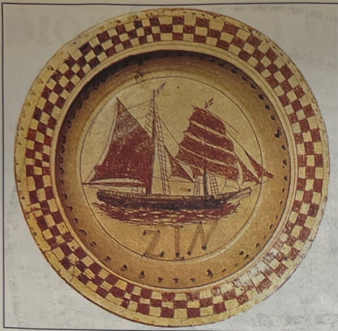
Πιατέλα με ζωγραφική παράσταση γολετόμπρικου. Σίφνος, Απολλωνία, Λαογραφικό Μουσείο (από το βιβλίο του Β. Κυριαζόπουλου, «Ελληνικά παραδοσιακά κεραμικά»).