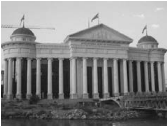
Le nouveau Musée archéologique de Macédoine à Skopje (l'état en 2012)

La différence entre science et pseudo-science n'est nullement évidente dans cette quête d'une continuité historique depuis les temps anciens. En 2006, deux professeurs ingénieurs, dont l'un est membre de l'Académie macédonienne des sciences et des arts, ont déclaré qu'ils avaient déchiffré l'inscription centrale sur la Pierre de Rosette et qu'elle était rédigée en macédonien. Ils prétendaient y avoir reconnu des mots et des expressions de la langue macédonienne actuelle. Il est question du texte qui est en réalité rédigé en langue égyptienne et en écriture démotique. Même si des linguistes, comme l'académicien Petar Ilievski, ont démontré le caractère charlatanesque de la