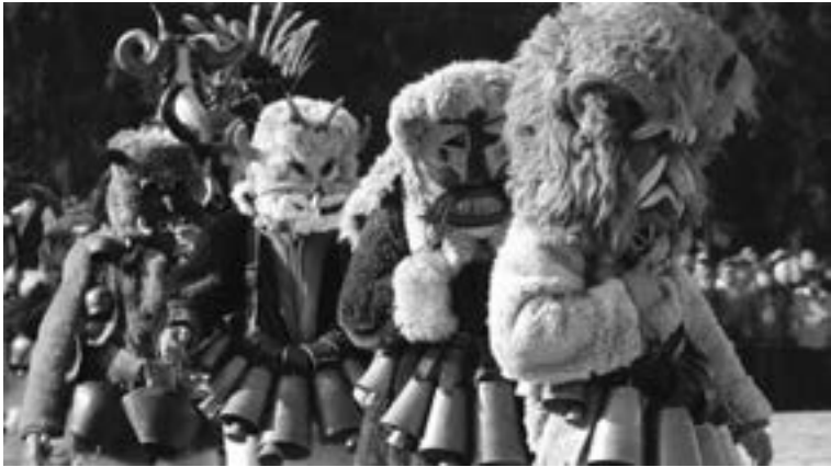
Défilé de Kukeri en Bulgarie. Photo : BTA

(source : http://static.bnr.bg/sites/radiobulgaria/culture/news/publishingimages/634/2011-01-17-020_1.jpg , dernier accès : 31/10/2015)