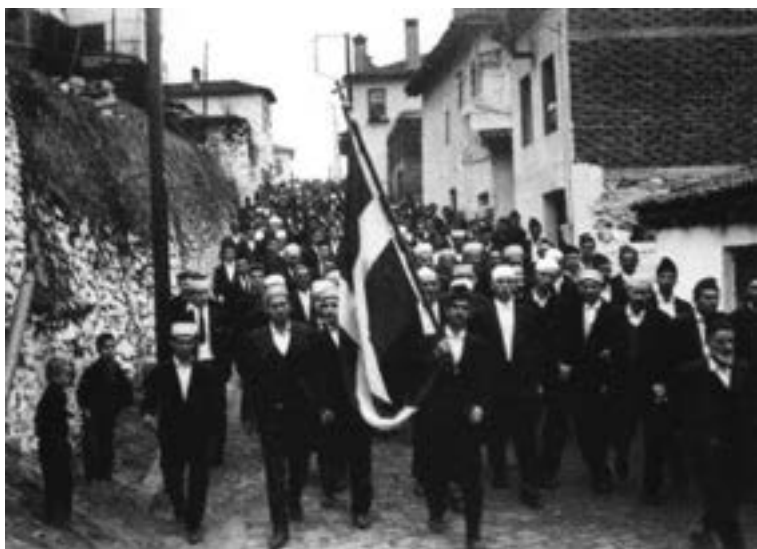
Un groupe de Pomaks du village d'Echinos (pomak/bulgare : Šahin ; turc : Şahin) part à la Mecque avec le drapeau grec (1965)

chants populaires représentant des versions de la ballade pan-hellénique du Pont d'Arta 248 .