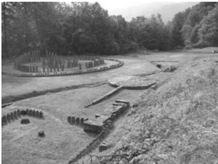
Sarmizegetusa Regia.

sophistication des connaissances astronomiques des Daces, dotés de leur propre calendrier solaire 141 .