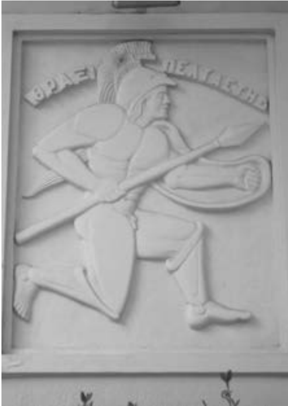
Image d'un peltaste thrace dans le centre-ville de Xanthi (Thrace grecque)