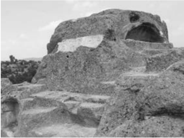
Le « Tombeau d'Orphée » à Tatul (Rhodopes bulgares)

le temple dans les Rhodopes de l'est et, ainsi, personne n'a eu la chance de le « découvrir ».