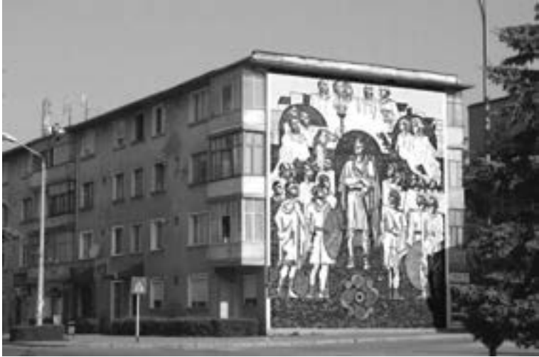
Immeuble de l'époque de Ceaușescu avec une représentation de Daces (Orăștie, Roumanie)

religion et la morale « supérieures » des Géo-Daces, leur esprit héroïque, leur propension à se sacrifier dans la bataille, leur idéalisme et leur absence de matérialisme. Sous le pouvoir de Nicolae Ceaușescu, secrétaire général du Parti communiste à partir de 1965, le nationalisme roumain de l'entre-deux-guerres a été réhabilité.