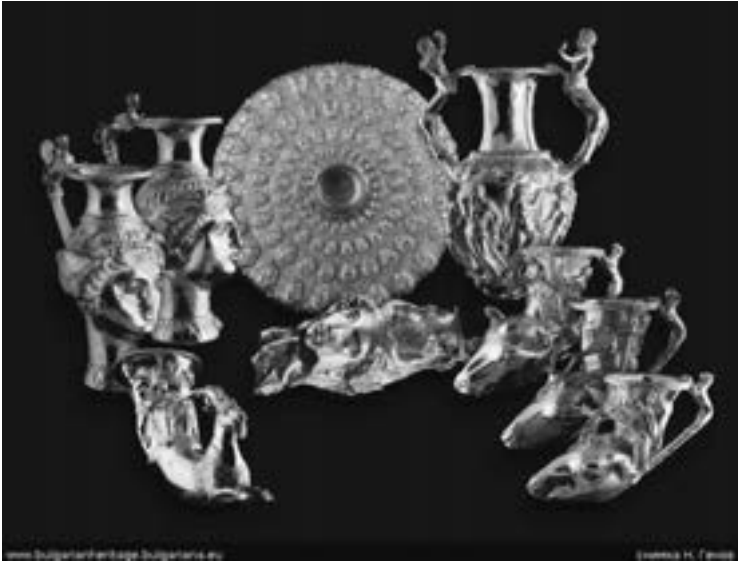
Le trésor de Panagjurište.

Très probablement, la ville du roi Seuthès (dit) III n'aurait pas eu ce destin, si elle avait été mise au jour dix ans plus tard. Dès les années 1960, sous l'autorité de Todor Živkov comme chef du parti et de l'État, les transformations idéologiques du régime communiste bulgare entraînèrent une mise en valeur du patrimoine thrace ancien sans précédent dans l'histoire du pays. Les développements en question étaient identiques à ceux en Roumanie : résurrection de la science « bourgeoise » et une politique à bien des égards progressivement nationaliste, en particulier dans le domaine de l'histoire. Parmi les résultats de cette évolution on constate une certaine tendance autochtoniste dans la quête de « racines » de plus en plus profondes de la nation, censées cimenter, sur le plan symbolique, la structure présente de l'État avec la domination du parti sur lui. Un nexus