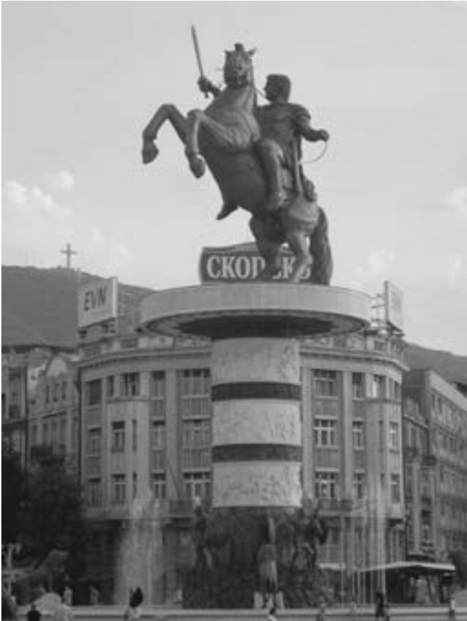
La nouvelle statue d'Alexandre le Grand à Skopje, la République de Macédoine