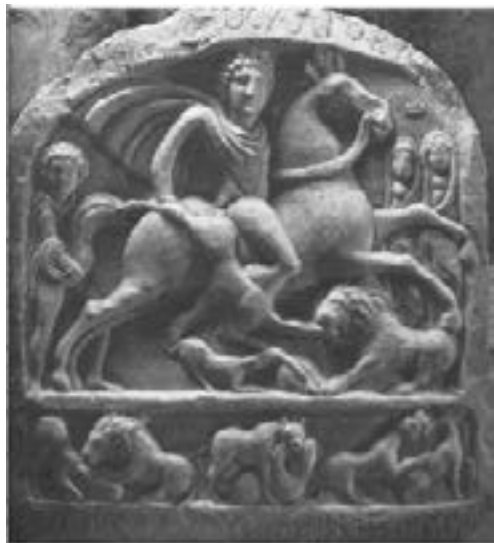
Plaque votive représentant le Cavalier thrace. III e s. apr. J.-C. Zlatna Panega, Bulgarie

funéraire grec 328 . Toutefois, ce fait ne le mène pas à une reconsidération du statut du Héros comme divinité thrace.