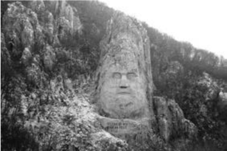
Statue rupestre du roi dace Décébale, construite entre 1994 et 2004 près d'Orșova (Roumanie)