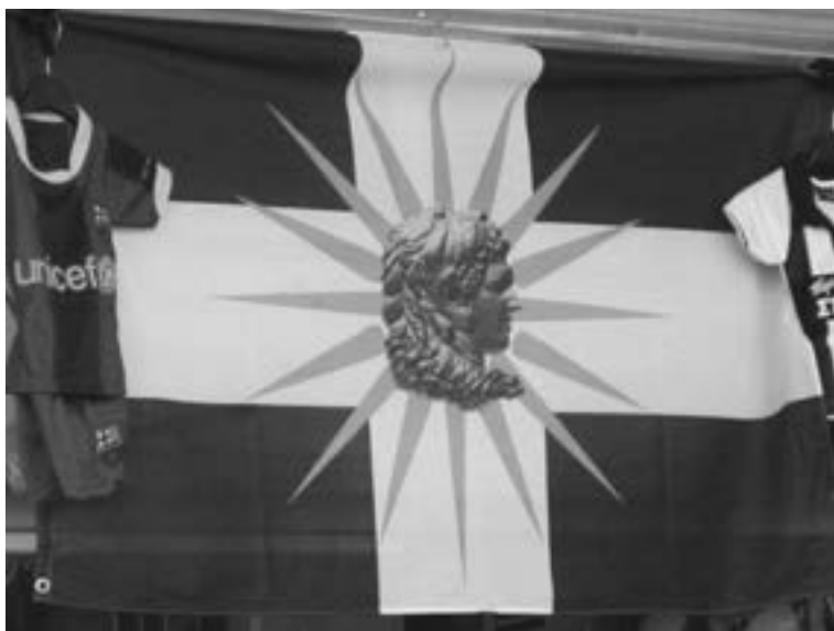
Drapeau grec avec « l'Étoile de Vergina » et l'image d'Alexandre le Grand à Thessalonique (juin 2011)

de l'art ont mis les grands sites de Grèce centrale et méridionale au centre des préoccupations des spécialistes.