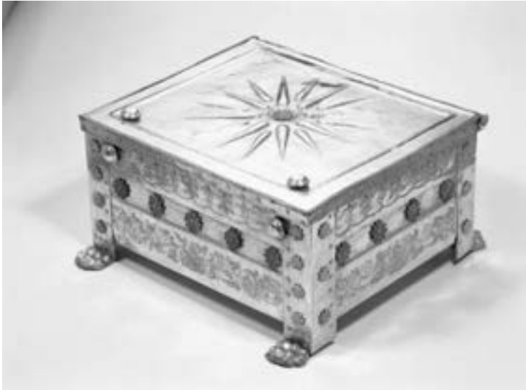
La larnax de la tombe de Philippe II (source : http://fr.wikipedia.org/wiki/Fichier:Image_larnax_of_philip.jpg , dernier accès : 31/10/2015)

À la suite d'un accord bilatéral en 1995, la République de Macédoine a de nouveau changé de drapeau : « l'Étoile de Vergina » a été remplacée par un soleil stylisé à huit rayons. Cependant, le drapeau précédent n'a jamais été complètement abandonné. Il a été fréquemment brandi par certains milieux nationalistes macédoniens, à l'intérieur et en dehors de la république ex-yougoslave. Depuis 2008, lorsque la Grèce a imposé son veto contre l'intégration de celle-ci à l'OTAN (en violation de l'accord de 1995), « l'Étoile de Vergina » a réapparu un peu partout dans le paysage public de la Macédoine ex-yougoslave, bien que de façon informelle. On la retrouve sur des drapeaux, des souvenirs touristiques et même sur des carreaux de pavage.